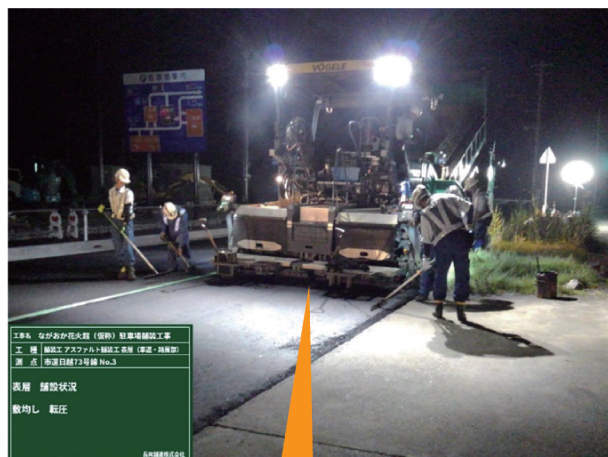
工事名 ながおか花火器（仮称）駐車場舗装工事 工種 舗設アスファルト舗設工事（車道・歩道） 測点 国道17号線 No.3 表層 舗設状況 敷均し 転任