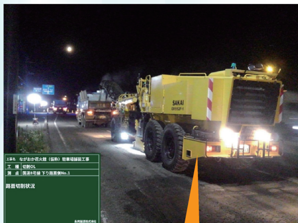
工事名 ながおか花火器（仮称）駐車場舗装工事 工種 切削CL 測点 国道17号線 下り線No.1 路面切削状況